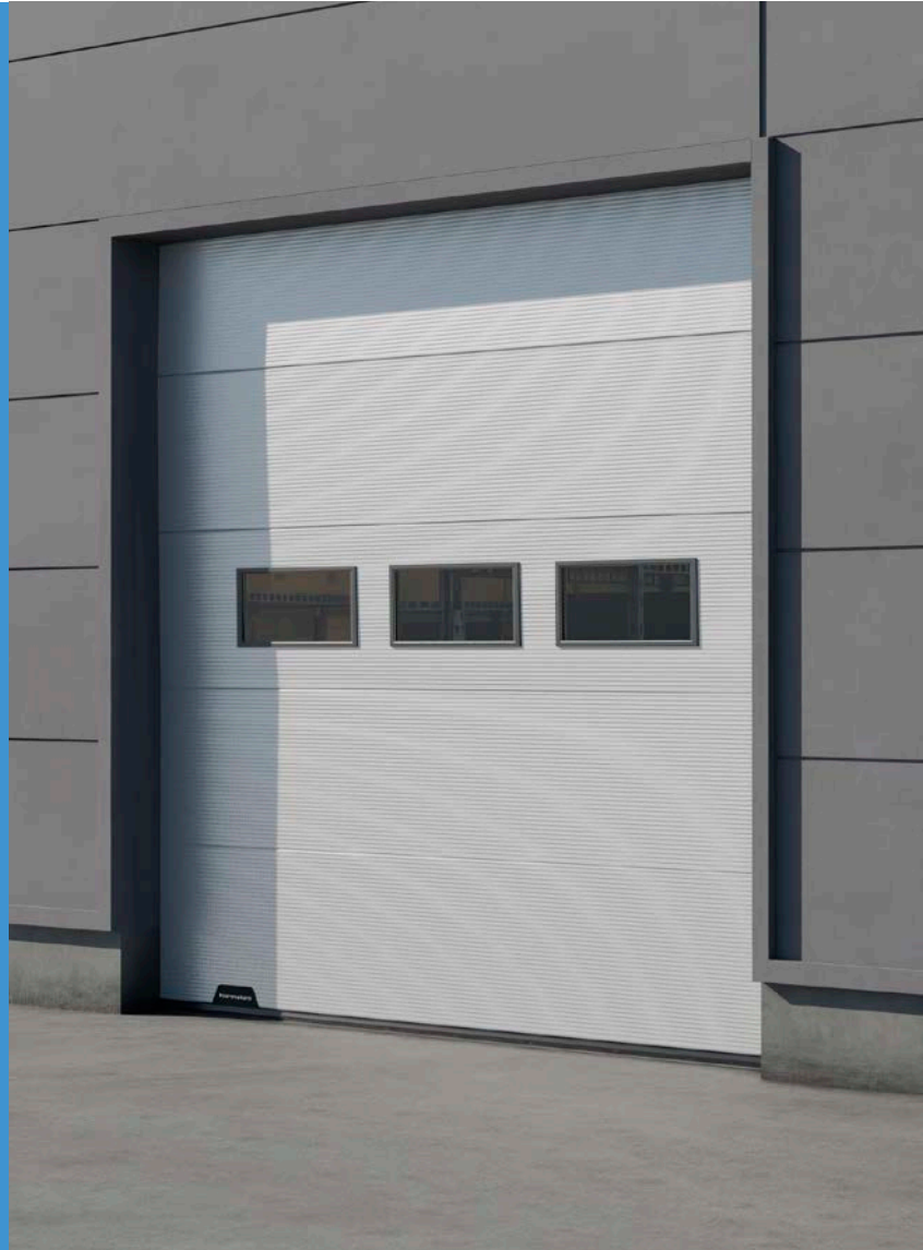
Normstahl Sektionaltor ID40P

Dies ist ein Sektionaltor, das Ihnen alles bietet, was Sie brauchen – und nichts, was Sie nicht brauchen.