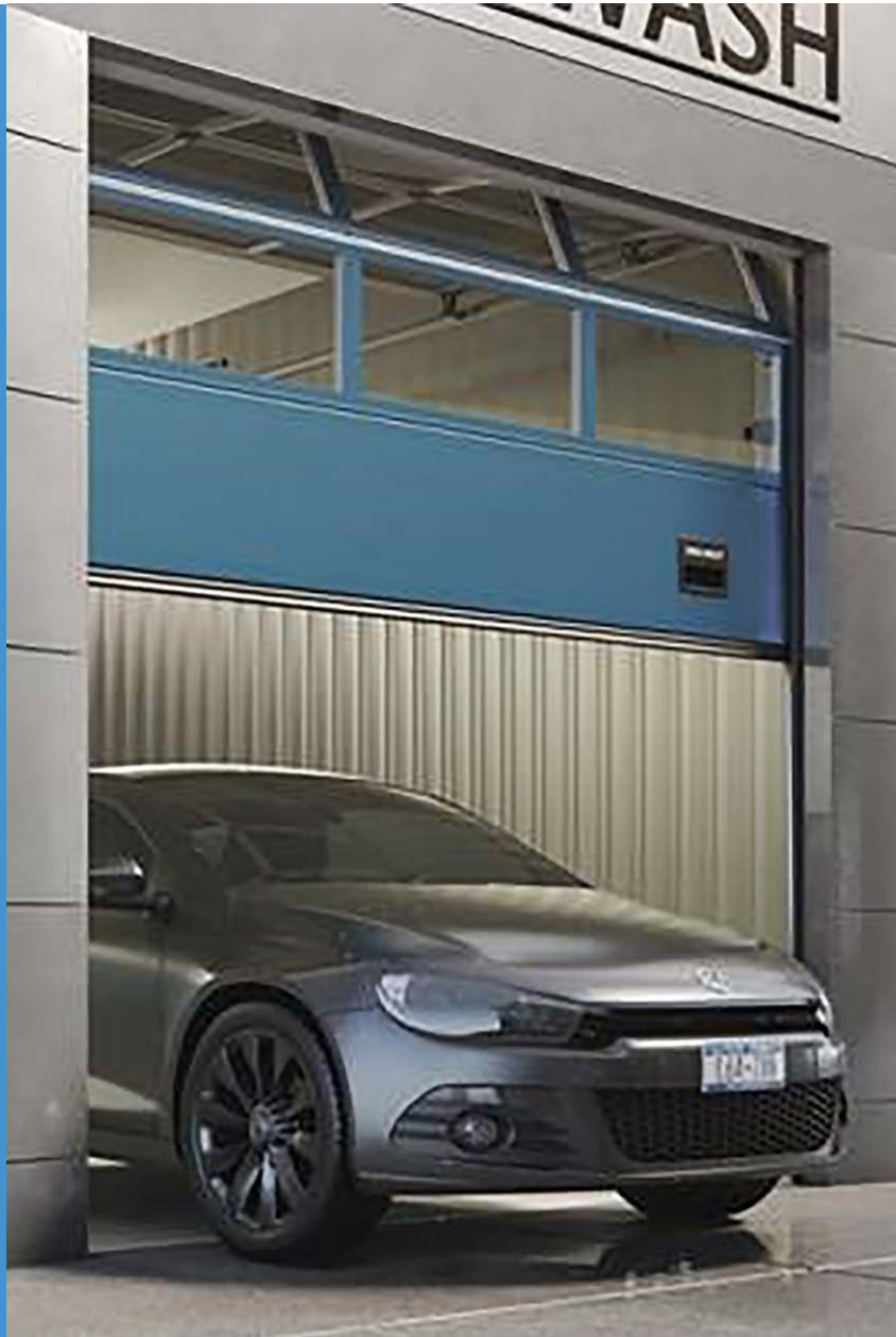
Normstahl Sektionaltor mit Direktantrieb OSP42DD

Das Normstahl OSP42DD funktioniert auf gleiche Weise, wie andere einfachere Standard-Tore. Das normale federbasierte System wurde jedoch durch einen stärkeren optimierten Motor und ein besseres Steuerungssystem ersetzt. Dies steigert die Zuverlässigkeit von Öffnung und Schließung, während Abnutzungs- und Verschleißrisiko, Wartungsaufwand und der Bedarf an vollständigen Abschaltungen verringert werden. Ihr Betrieb steht also nie still.